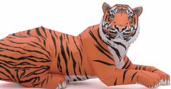
「スマトラトラ」 ごとう けい 作