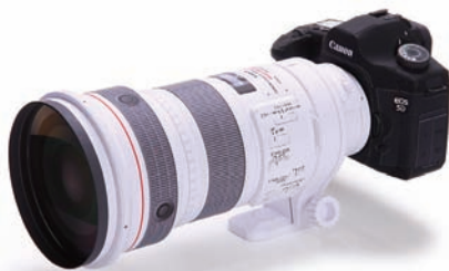
「CANON EOS 5D+EF300mm F2.8L IS USM」 光武 利将 作